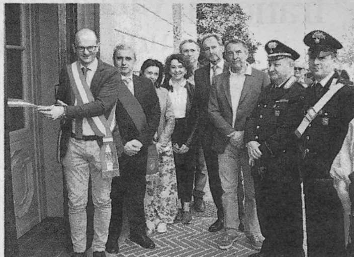
L'inaugurazione dell'edificio rinnovato: al suo interno 4 alloggi per anziani singoli o in coppia